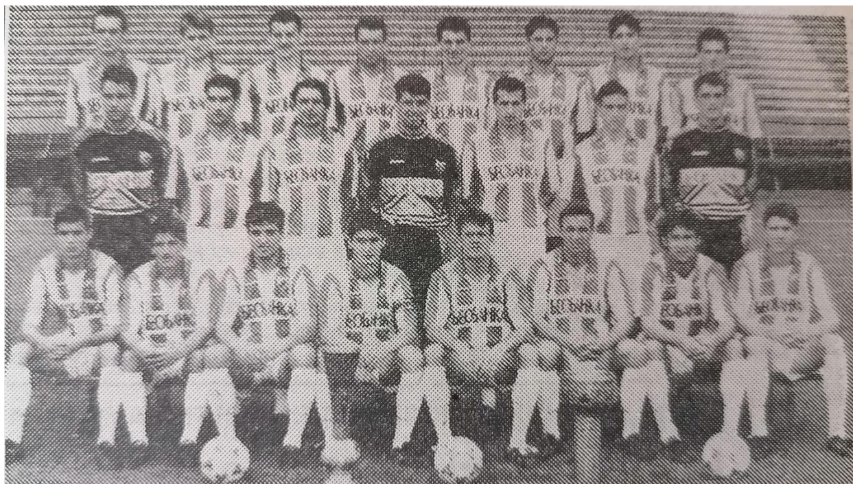
У ком ће купу играти: шампионски тим Црвене звезде

Crvena zvezda 1994 / 95, osvajač duple krune