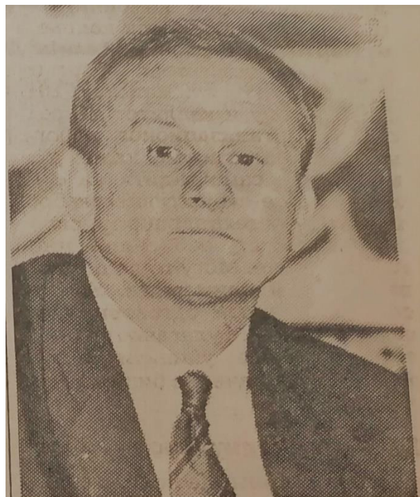
Тренер за титуле Љупко Петровић