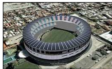
Vista actual del estadio de Racing, inaugurado en 1950.

Por su parte, Racing hilvanó una serie de 5 triunfos consecutivos, por lo que al jugarse la fecha 25, le había sacado 8 puntos de ventaja a San Lorenzo. En este envión de Racing, mucho tuvo que ver la inauguración de su estadio el día 3 de septiembre en el partido frente a Vélez de la 21ª fecha. Racing ganó los 7 partidos que jugó de local en su estadio, proclamándose campeón dos fechas antes de la finalización del campeonato.