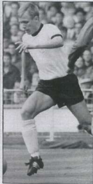
Am Flügel und in der Mitte stark: Held