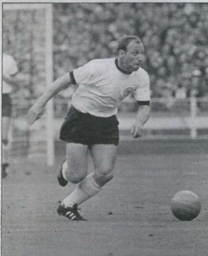
Nach wie vor Weltklasse: Uwe Seeler, Kapitän der Nationalelf und seines HSV.