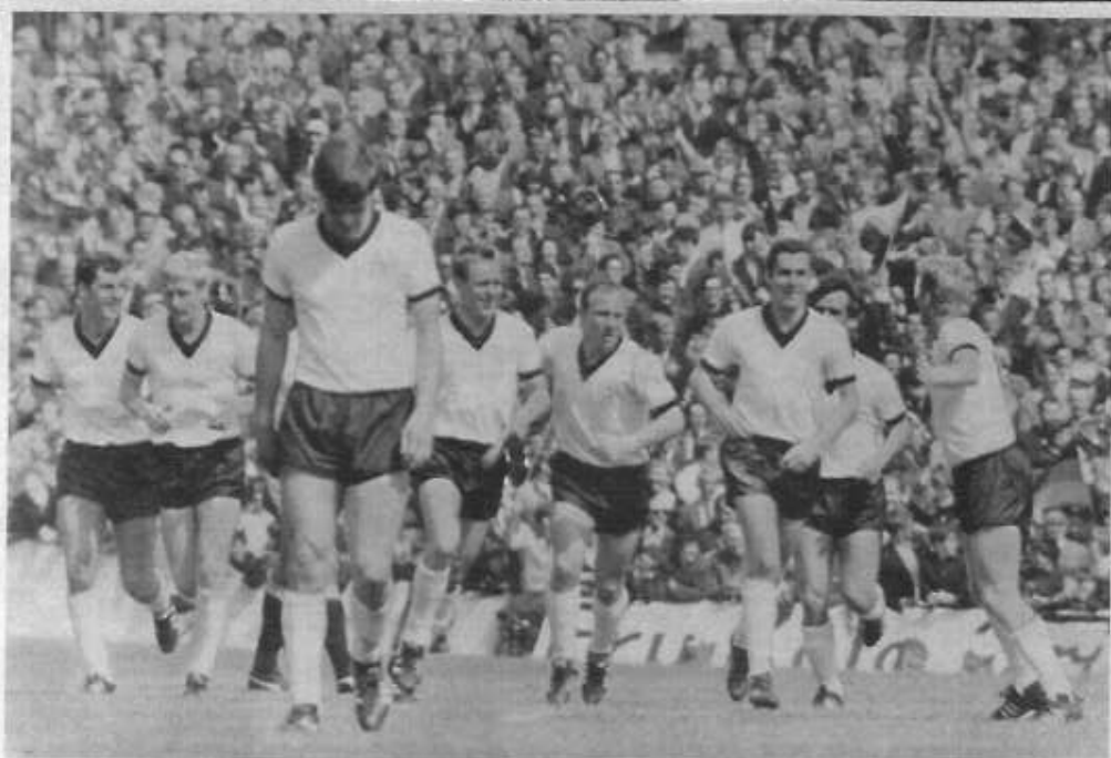
Acht deutsche Stars auf einem Bild — eine Erinnerung an die Fußball-WM in England, Höhepunkt des Jahres 1966.

Auch das Vordringen vieler Versprechender junger Talente macht sich in unserer Rangliste bemerkbar. Besonders