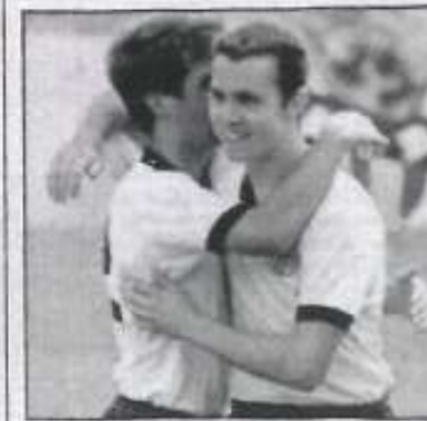
Weltklasse: Overath, Beckenbauer

Giegeling (Heiligenhaus), 21. 4. 1936 Kreh (1. FC Haßfurt), 14. 2. 1937