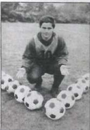
Gefährlicher Schütze: Gerd Müller